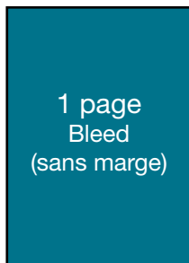
5,25 po (L) X 8,25 po (H)