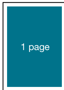
4,25 po (L) X 7,25 po (H)