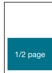
4,25 po (L) X 3,5 po (H)