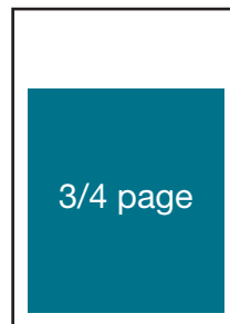
4,25 po (L) X 5,4375 po (H)